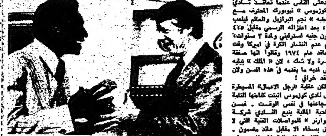
بيشه الذي نشر حب كرة القدم امريكا يقدم كرة تكافؤ للسريين

دعش القاس عندما تعاقبت تسدي «كوزموس» نيويورك الحرف مع «بيشه» نجم البرازيل والمالك ليليب له، بعد اعتزاله الرسمي مقابل 25 مليون جنيه استرليني واداة 2 سنوات، رغم عدم النشر الكرة في امريكا وقت التعاقد عام 1974 وقلقا انها حققة خاسرة ولا شك، ان «الملك» بيشه ليس لديه ما يقدمه في هذه السن ولان كسارن.